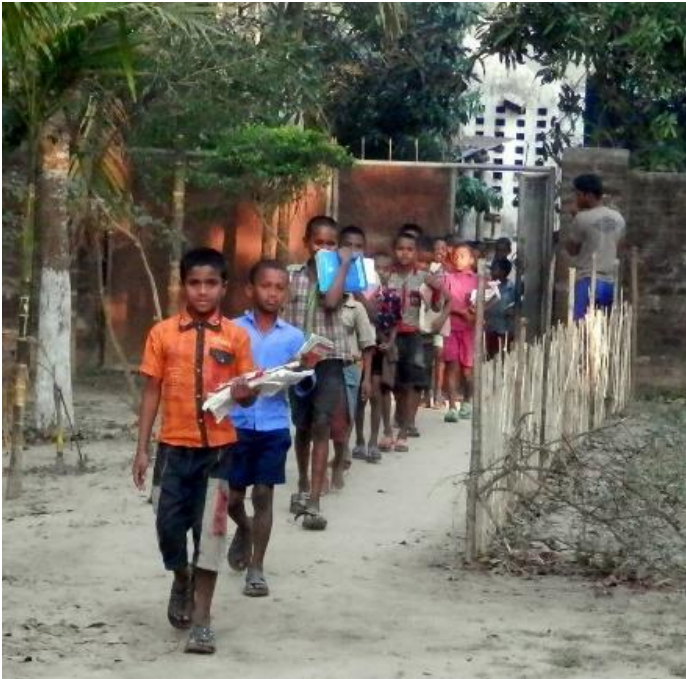
Kuvassa asuntolan lapsia matkalla viereiseen kouluun.

tarkka viikko-ohjelma. Lapset osallistuvat huoneittensa siivoamiseen ja yhteisiin töihin ja saavat vapaa-ajallaan leikkiä, pelata tai jutella yhdessä sekä totuttautua kristilliseen elämään. Asuntolassa tehdään tärkeää työtä kasvavan sukupolven eteen.